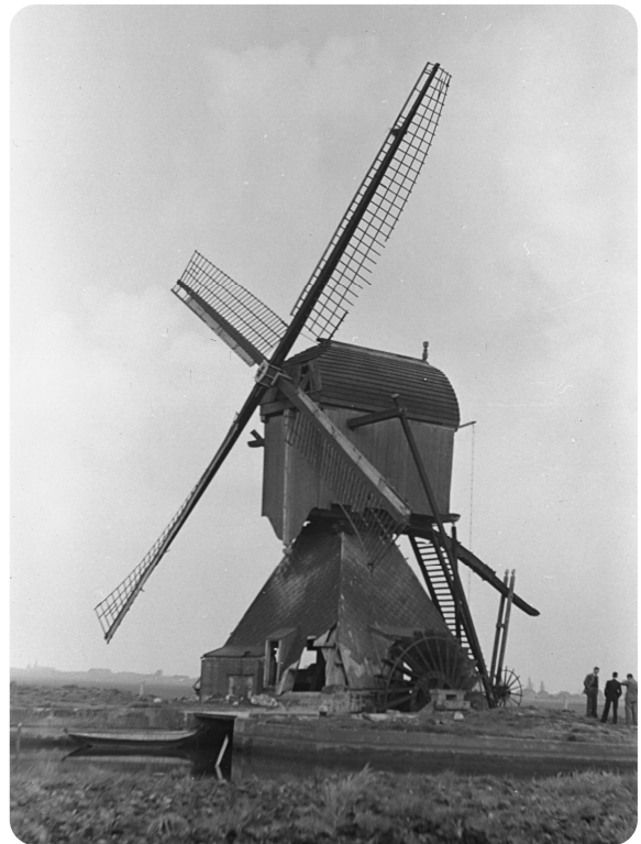
De molen kort voor de afbraak in 1954.

Moeder is gevonden bij de Sas, bij de kerk. Daar is ze aangespoeld. We hebben haar niet meer mogen zien. Later hebben we nog een sjaaltje van haar gevonden. Dat heb ik nog. Meer niet. Een paar dagen later hebben ze Neeltje en Teunis gevonden. Toen zijn ze mij en Trijntje komen halen. Ze zijn netjes gewassen, netjes de haren gekamd. Daar lagen ze. Helemaal opgezet natuurlijk. Toen we net terug waren konden we