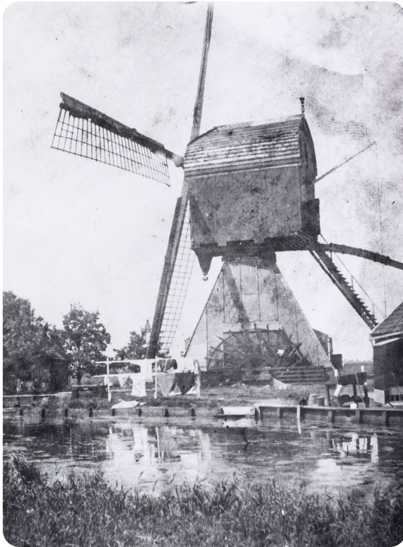
Molen, boezem en waslijn.

Toen zei pa “kom nou maar, we zijn veel te blij dat je weer goed bent, nooit meer doen hoor”. “Nee, pa.” We hebben het toen nooit meer gedaan [lacht].