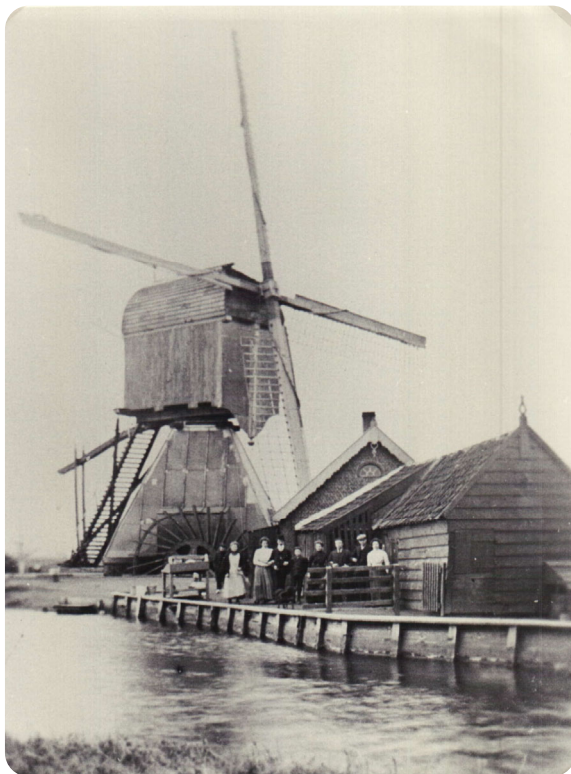
De molen met het molenaarshuis en schuur.