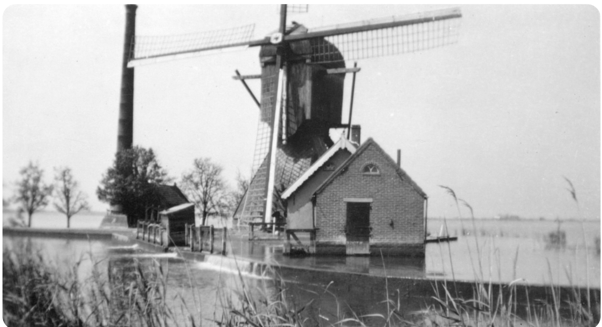
De molen met woning en ‘loods’ tijdens de inundatie in 1944-45.