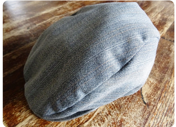
Pet van vader Noorlander

openen in de schuur. Dat lukte niet, maar ze is later wel drank en bier gaan verkopen aan vissers die bootjes bij haar huurden.