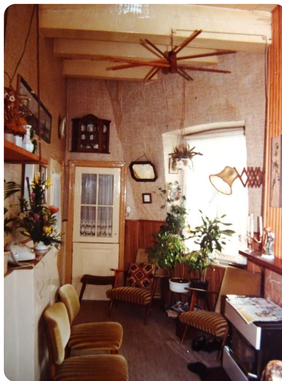
Interieur van de molen

Nelly: Wij kinderen hoefden in principe niets met de molen te doen, maar we hebben wel geleerd de molen op de vang te zetten. Alleen maar uit lolligheid hoor, we hoefden niet te draaien. Mijn vader was daar dan altijd bij. We moesten dan naar de balie toe, daar mochten wij normaal nooit komen, het was geen speelplaats.