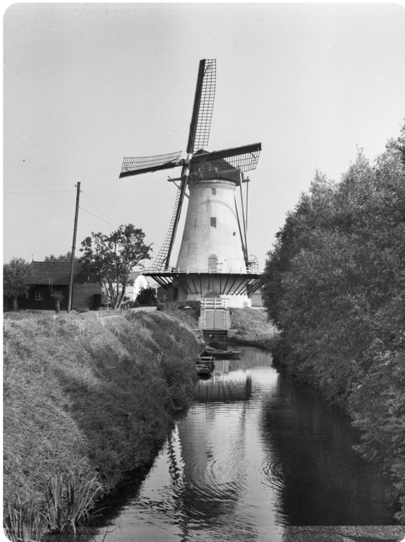
De Haastrechtse molen in 1957