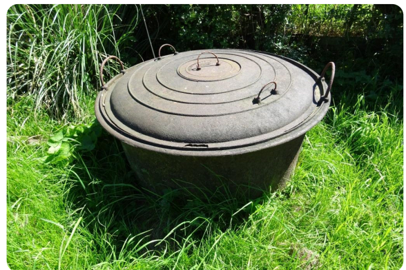
De taanketel

wisten heel vaak niets. We hadden geen telefoon, want je woonde buiten het dorp. Je had ook nooit vriendinnetjes. Ik had een zus, die was een jaar ouder, en een zusje, die was een jaar jonger. Dus je was wel met zijn drieën, maar je stond buiten het dorpse. Ik vond dat best jammer. Soms ging ik wel bij een vriendinnetje spelen in het dorp. Ik voelde me daar zo wereldvreemd dat ik me er helemaal niet thuis voelde. Die hadden een slaapkamertje. "Kom, we gaan op mijn slaapkamertje spelen." Dan zaten we op het bed en dacht ik "en nu?". Dat was voor haar vertrouwd, maar wij hadden geen slaapkamer. Ik sliep gewoon op een zolder, totdat we gingen trouwen. We hadden een kledingkast staan, twee planken voor mij en twee planken voor mijn andere zus. Dus ja. En als ze bij ons kwamen spelen was het voor hen een feest. We gingen roeien, we gingen in het water spelen. Ben je op een molen geboren; dan is dat gewoon heel anders.