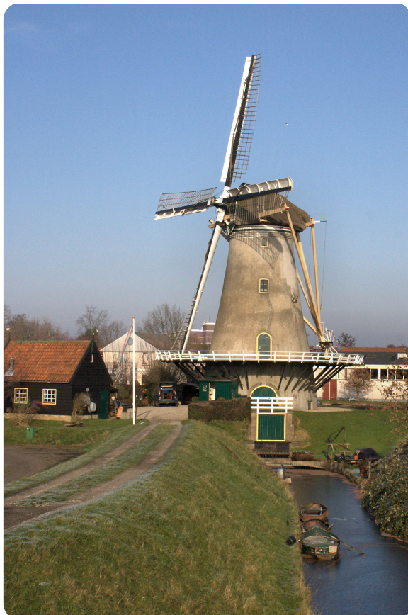
Haastrechtse molen anno 2010