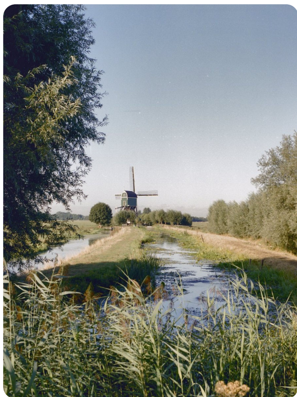
De Bachtenaar

Jan: De Bachtenaar stond eigenlijk al stil voor de oorlog, maar die hebben ze in de oorlog weer op gang gebracht want de diesel en de benzine waren op. Daardoor kon mijn vader toen die molen krijgen. Op 1 april 1945 is de molen weer stilgezet en is mijn vader naar Beneden-Haastrecht gegaan. Daar woonde een oom van hem op, daar heeft hij het van overgenomen. Dat ging allemaal in samenspraak.