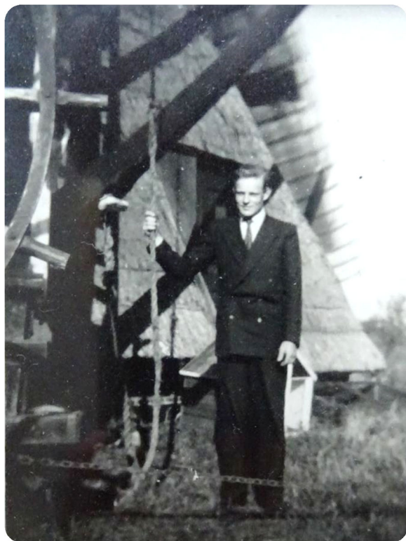
Bij de molen (Particuliere collectie)