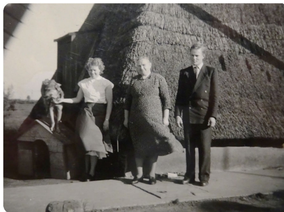
Met moeder voor de molen. Links de herdershond, op het hondenhok