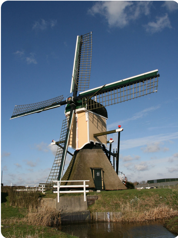
Groenendijkse molen