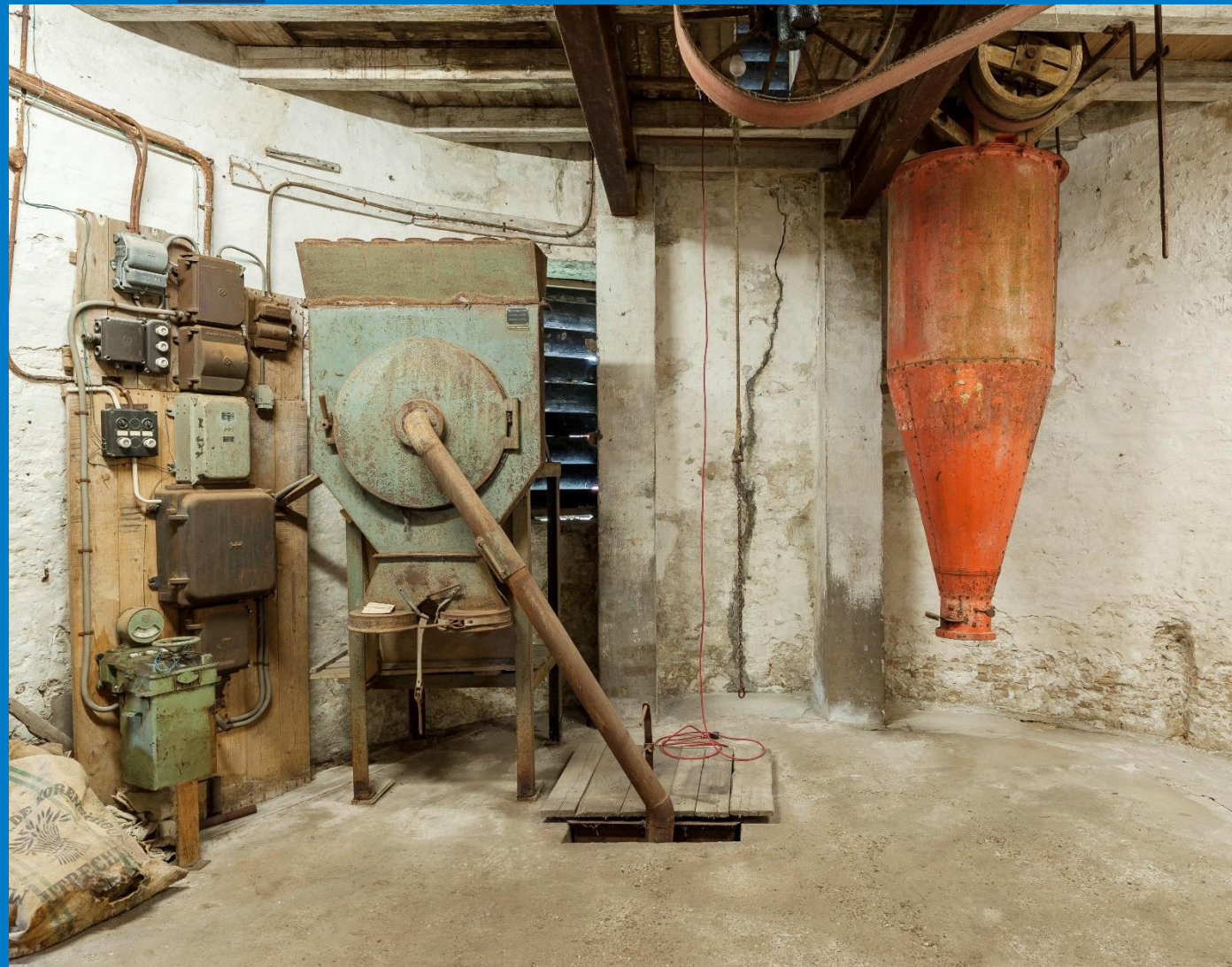
Links: Detail van de binnenkant van een deur van de molen de Koker in Wormer. Foto J. Rodrigues sept./2023 Rechts: Impressie van de BG van de maalderij installatie in de molenrestant de Hoop in Sint-Laurens – Zeeland. Foto beeldbank RCE/2015.