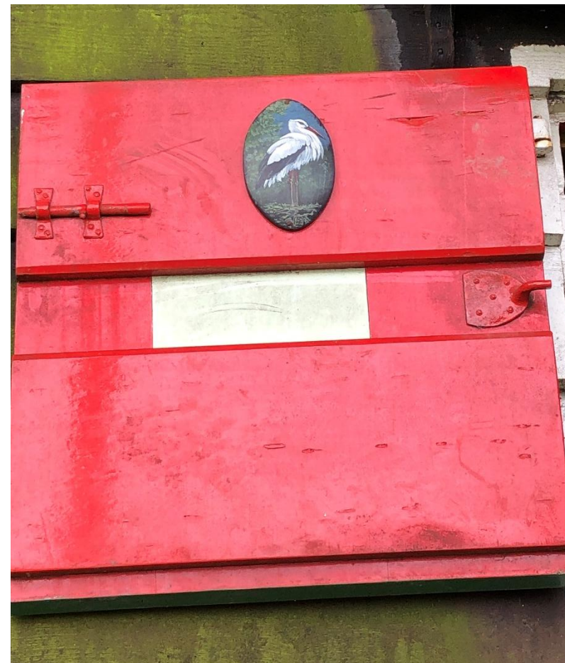
Schilderijtje van een ooievaar aan de binnenkant van de voordeur van de molen de Ooievaar in Zaandam – Noord-Holland. okt./2023.