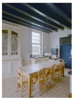
In deze keuken bleef de pomp, een oude brandstof en de oorspronkelijke baksteen.

Interieurs van oude gebouwen worden geregeld aangepast aan veranderende eisen van gebruik en comfort. Deze brochure vraagt aandacht voor het cultureel-historisch waardevolle onderdeel. Tal van praktische adviezen leveren ideeën om de binnenkant van het pand met respect voor deze elementen te verbouwen.