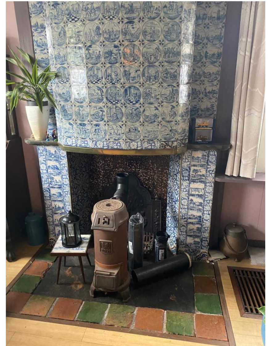
Links: Impressie woongedeelte van de molen de Vlieger in Voorburg. Foto J. Rodrigues okt./2024. Rechts: Schouw in de woongedeelte van de molen de Bleeke Dood in Zaandijk. Foto R. Gremmer sept/2023.