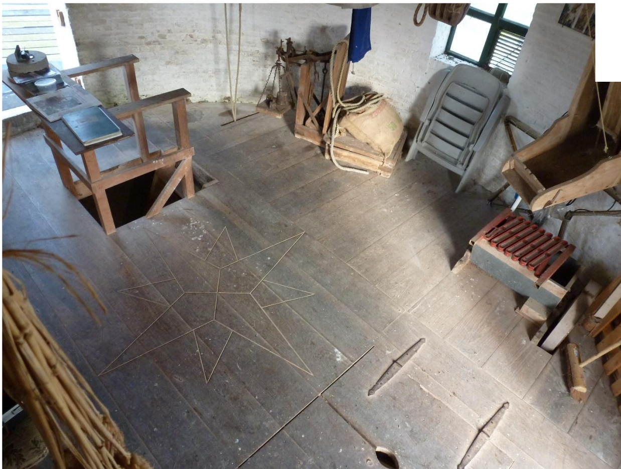
Vloerafwerking maalzolder de Witte molen in Rilland – Zeeland. okt./2023.