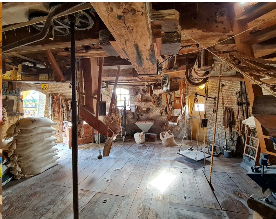
Links: Foto impressie van de steenzolder bij de molen de Vliegende Hert.