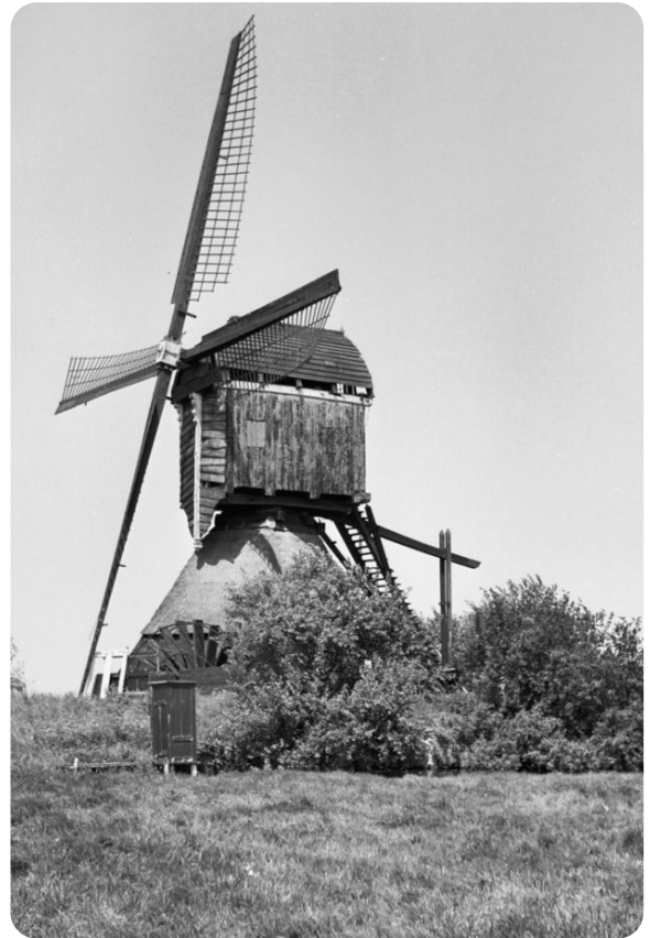
De Oude Weteringmolen anno 1968

Na verloop van tijd was alles in kannen en kruiken. Toen kwamen de burgemeester en prins Claus aan met de boot. Met veel ceremonie werden ze welkom geheten en van boord begeleid. Er was destijds geen pad of gras, daarom hadden ze platen neergelegd om overheen te lopen. De burgemeester ging voorop, daarachter liep prins Claus. Toen prins