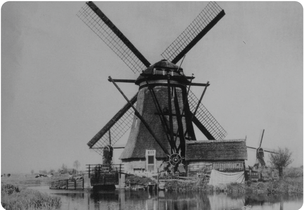
Blik op de Achtkante Molen, ca 1935-1940.